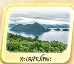
ทะเลสาบโทยะ