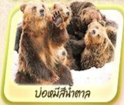
บ่อหมีสีน้ำตาล