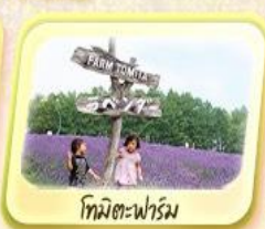
โทมิตะฟาร์ม