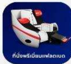
ที่นั่งพรีเมียมเฟลตเบด