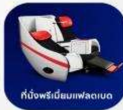
ที่นั่งพรีเมียมเฟลตเบด