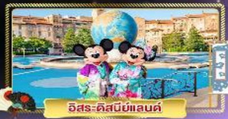
อิสระ-ดิสนีย์แลนด์