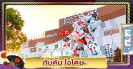
กันดั้ม ไฮโดเมะ