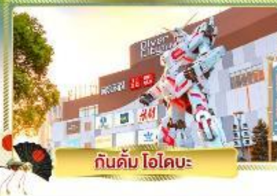
กันดั้ม โอไดบะ