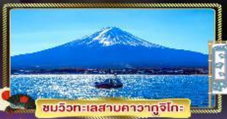
ชมวิวกะเผลสามคาวากูจิโกะ