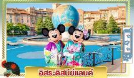
อิสระ-คิสนีย์แลนด์