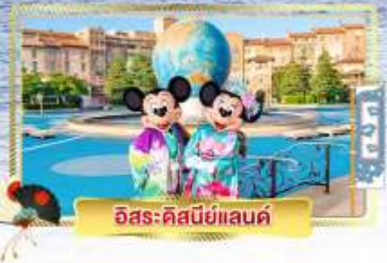
อิสระ-คิสนีย์แลนด์