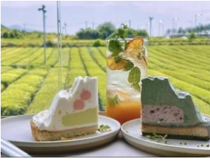
ยิ่งใหญ่อลังการของไรชาที่นี่

พาท่านเดินทางสู่ ไรชาเขียวโอซุลลอค ขึ้นชื่อที่สุดแห่งเกาะเชจู O'Sulloc ซึ่งจะแบ่งเป็นโซนไรชากลางแจ้ง และโซนพิพิธภัณฑ์ที่มีการจัดแสดงเรื่องราวของชา ร้านคาเฟ่ และร้านขายของฝาก ซึ่งท่านสามารถเยี่ยมชมได้ทุกโซน เกาะเชจูเป็นดินแดนที่ได้รับของขวัญจากธรรมชาติ ปลูกชาเขียวได้คุณภาพสูง ผสมผสานกับนวัตกรรมสมัยใหม่ จนทำให้ชาที่นี่ส่งออกไปขายทั่วโลก นักท่องเที่ยวทั้งเกาหลีและต่างชาติมักมีจุดมุ่งหมายที่จะมาลิ้มรสความอร่อยของชาที่มีรสชาติเป็นเอกลักษณ์ถึงแหล่งผลิต โดยเฉพาะไอศกรีมชาเขียว เค้กโรล เครื่องดื่มชาเขียวทั้งร้อนและเย็น รับประกันความฟินไปตามๆกัน ส่วนใครที่เน้นการชมวิวถ่ายรูป สวยทุกมุมจนกดชัตเตอร์รัวๆแน่นอน ไม่ว่าจะเป็นโซนไรชา หรือขึ้นไปจุดชมวิวด้านบนสุดของพิพิธภัณฑ์ ก็จะเป็นความ