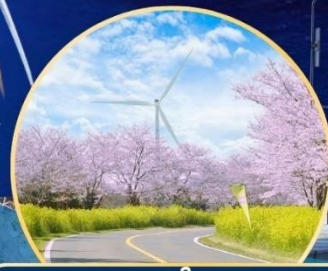
ซากุระ / ทุ่งดอกเรป