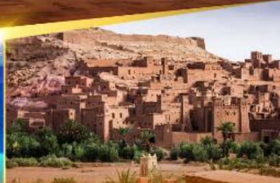
Kasbah of Ait Ben Haddou