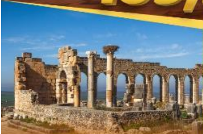
Roman City of Volubilis

เปิดประสบการณ์อนันต์ดาวสุดฟิน กลางทะเลทรายซาฮารา "Luxury Camp"