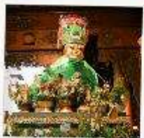
ขอพรแม่ย่า