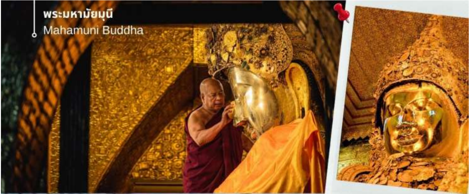
พระมหามุนี Mahamuni Buddha

นำท่านเดินทางสู่ เมืองสกายน์ หรือชะไก้ (Sagaing) ตั้งอยู่บนฝั่งขวาของแม่น้ำอิรวดี ตรงข้ามกับเมืองอังวะ เมืองชะไก้มีวัดทางพุทธศาสนาที่สำคัญหลายแห่ง เมืองสร้างขึ้นตั้งแต่คริสต์ศตวรรษที่ 14 เพื่อเป็นเมืองหลวงของอาณาจักรชะไก้ ซึ่งเป็นหนึ่ง