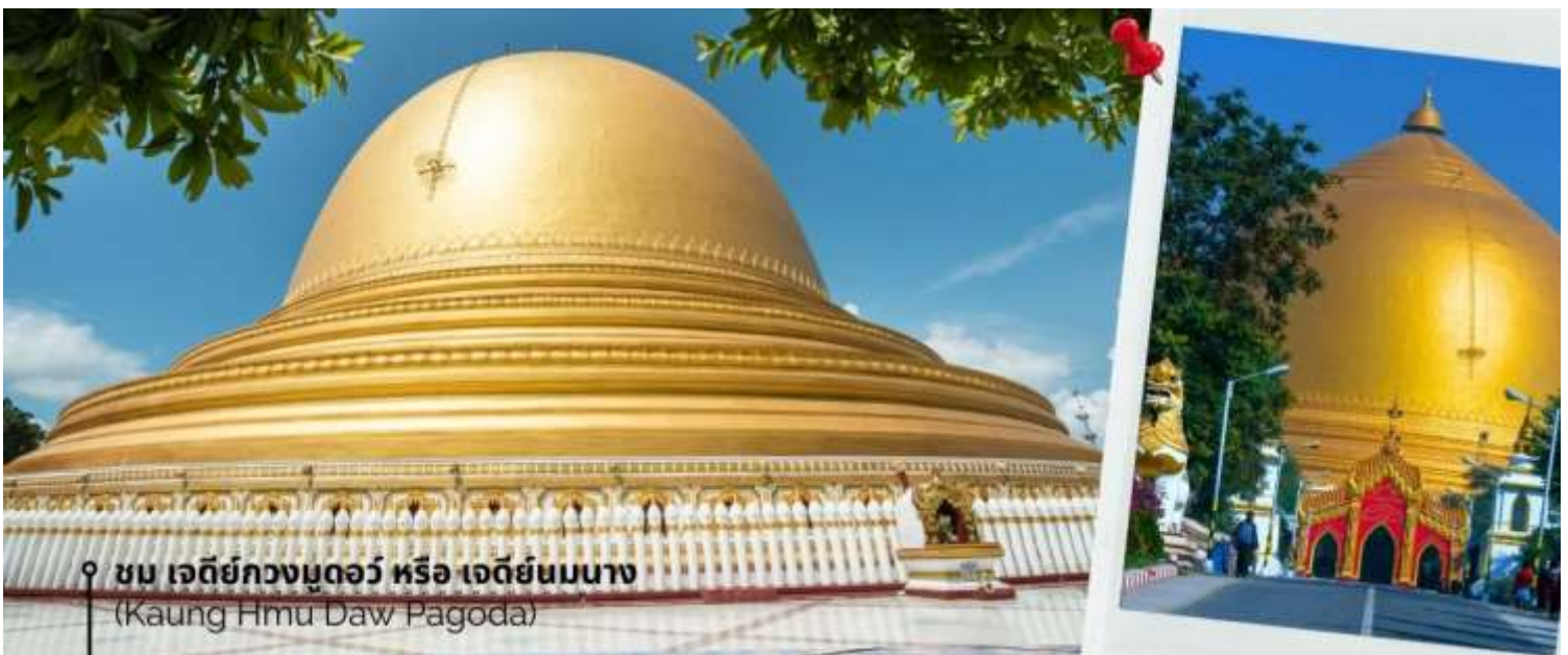
ชม เจดีย์กวงมุดอว์ หรือ เจดีย์นมนาง (Kaung Hmu Daw Pagoda)

นำท่านชม เจดีย์กวงมุดอว์ หรือ เจดีย์นมนาง (Kaung Hmu Daw Pagoda) เป็นเจดีย์พุทธขนาดใหญ่ ตั้งอยู่เขตชานเมืองทางตะวันตกเฉียงเหนือของชะไก้ โดยจำลองตามสวัณณมาลีมหาเจดีย์ ในประเทศศรีลังกา ฐานชั้นล่างสุดของเจดีย์ประดับด้วยนระและเทวดา 120 องค์ ล้อมรอบด้วยโคมหิน 802 ต้น ซึ่งแกะสลักพร้อมจารึกพุทธประวัติสามภาษาได้แก่ พม่า, มอญ และไทใหญ่ เป็นตัวแทนของสามภูมิภาคหลักสมัยอาณาจักรตองอูยุคฟื้นฟู โดมของเจดีย์ได้รับการทาสีขาวอย่างต่อเนื่อง เพื่อแสดงถึง