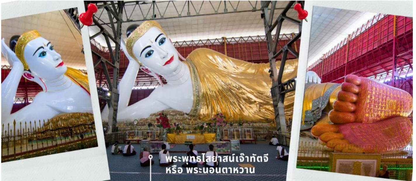
พระพุทธไสยาสน์เจ้ากัตจี หรือ พระนอนตาหวาน

นำท่านสักการะ พระพุทธไสยาสน์เจ้ากัตจี หรือ พระนอนตาหวาน ซึ่งเป็นพระพุทธรูปไสยาสน์องค์ขนาดใหญ่ที่มีความสูงถึง 6 ชั้น ยาวกว่า 70 เมตร ใช้โครงเหล็กกันถึง 65 เมตร มีหลังคาคลุม 6 ชั้น สร้างขึ้นเมื่อปี 1907 ถูกยกย่องให้เป็นพระนอนที่มีขนาดใหญ่และงดงามที่สุดในพม่า ด้วยพระพักตร์ที่งดงามเปี่ยมยิ้ม ดวงตาทำจากลูกแก้วที่ส่งผลิตจากต่างประเทศ ทาขอบตาด้วยสีฟ้าและมีขนตาหนายาวทำให้ดวงตาดูหวาน จนถูกเรียกพระนามอีกชื่อคือ “พระตาหวาน” บริเวณพระบาทมีภาพวาดลายธรรมจักร ตรงกลางฝ่าพระบาทล้อมรอบด้วยรูปมงคล 108 ประการ ที่แสดงถึงอากาศโลก สัตว์โลก และสังขารโลก อีกทั้งจิวรยังมีลักษณะพลิ้วไหวสมจริงและตรงชายประดับด้วยอัญมณีแวววาว ถือเป็นพุทธศิลป์ที่มีความงดงามทรงคุณค่า