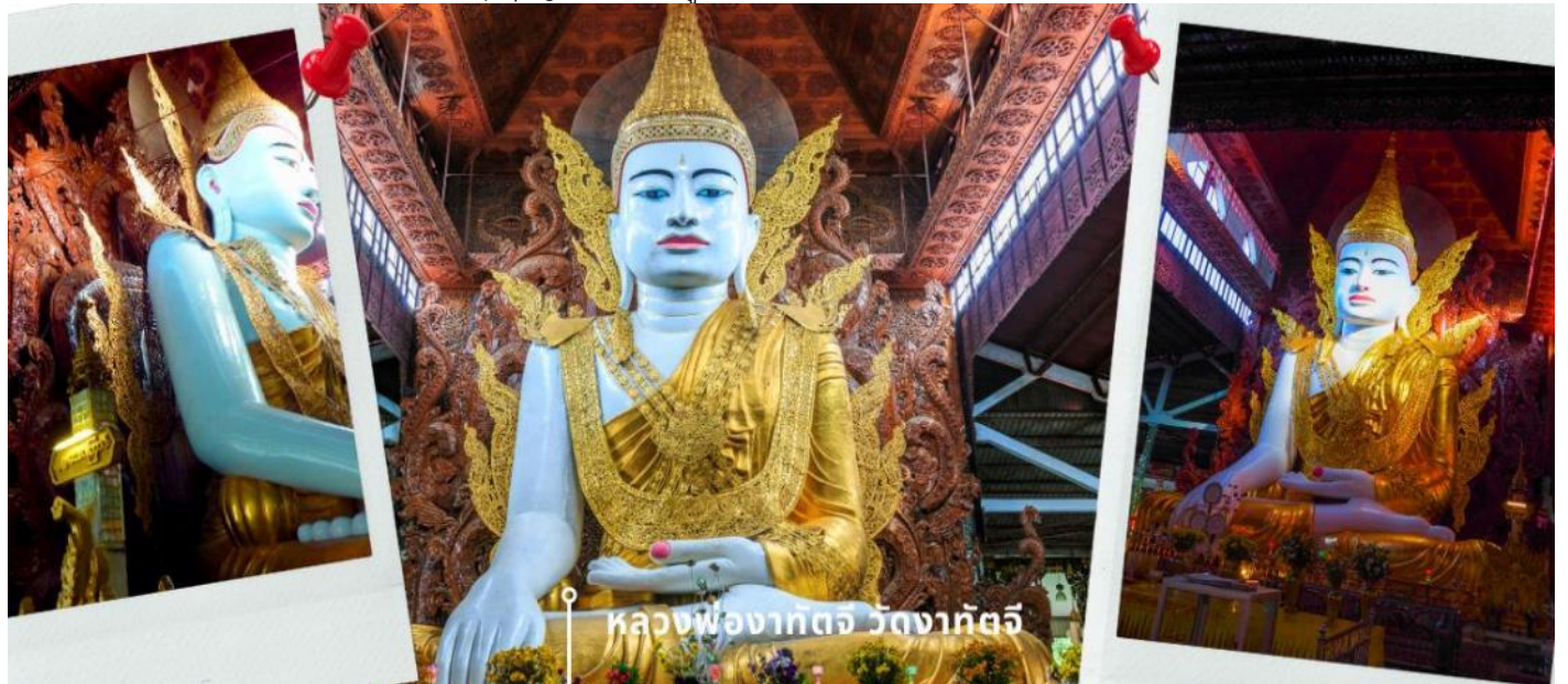
หลวงพ่อกงาตจ วัดงากตจี

จากนั้นสักการะ หลวงพ่องาทัจจี วัดงาทัจจี อย่างกึ่ง พม่า เป็นวัดที่ประดิษฐานพระพุทธรูปองค์ใหญ่ นั่นคือ หลวงพ่องาทัจจี แปลว่า "หลวงพ่อที่สูงเท่าตึก 5 ชั้น" เป็นพระพุทธรูปปางมารวิชัยที่แกะสลักจากหินอ่อน ทรงเครื่องแบบกษัตริย์ ส่วนด้านหลังเป็นไม้สักแกะสลักลวดลายต่างๆ จำลองแบบมาจากพระพุทธรูปทรงเครื่องสมัยยะตะนะโบง (สมัยมณฑลเลย) ส่วนประตูทางเข้าวัดงาทัจจีก็ประดับตกแต่งอย่างหรูหราด้วยหลังคาสีทองทรงปราสาทแบบพม่า 5 ชั้น และมีรูปปั้นสองสิงห์แบบศิลปะพม่าหรือจีนเต (Chinthe) เป็นทวารบาลอยู่ด้านหน้า วัดงาทัจจี ตั้งอยู่ที่ Ashay Tawya Monastery เมืองย่างกึ่ง ตรงข้ามวัดเจ้ากัตจี (Chauk Htat Gyi pagoda) หรือที่รู้จักกันในชื่อ “วัดพระตาหวาน” นั่นเอง