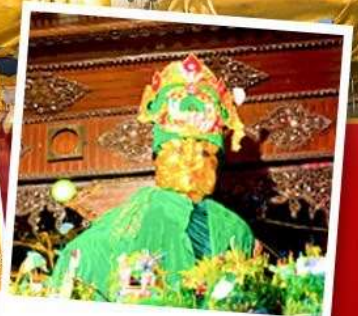
ขอพรมแม่ยักษ์