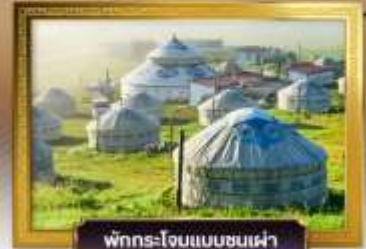
พักแรมแบบชนเผ่า

เดินทางโดย: สายการบินโซนาเซาเทิร์นแอร์ไลน์