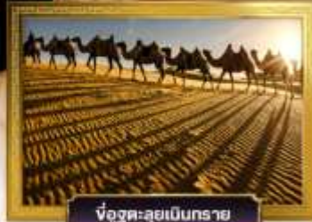
ขี่อูฐทะเลทราย