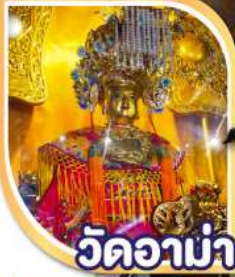
วัดอาน่า