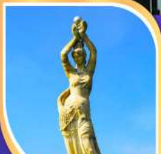
จูไห่พีชเชอร์เทิร์ล