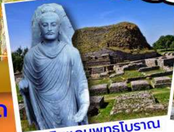
ดินแดนพุทธโบราณ ตักศิลา