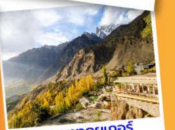
ยอดเขาดยูเกอร์