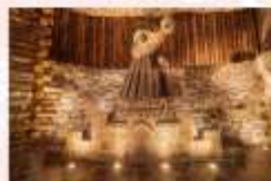
เหมืองเกลือวิลิชก้า