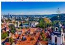
Vilnius Old Town