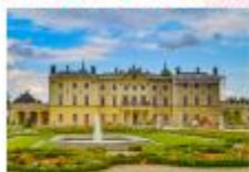
พระราชวัง Branicki