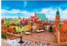
จัตุรัสเมืองเก่า