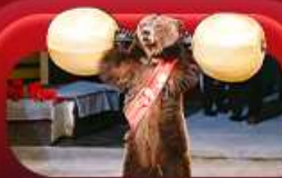
ชมละครสัตว์