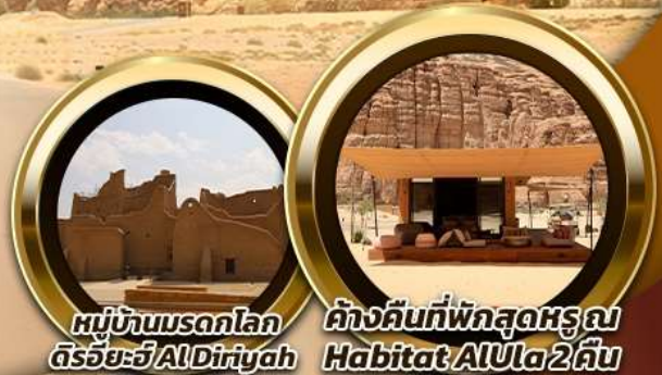
หมู่บ้านมรดกโลก Diriyah AlDiriyah

บินหรู อยู่สบาย เที่ยวซิลด์ ซิลด์ 10 ท่าน คอนเฟิร์มเดินทาง