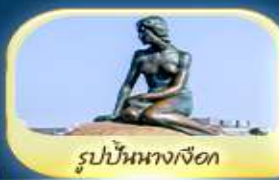
รูปปั้นนางเงือก