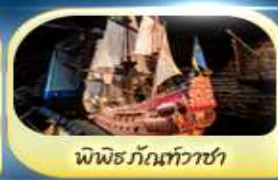
พิพิธภัณฑ์ทิวาชา