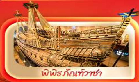
พิพิธภัณฑ์ท้าวชา