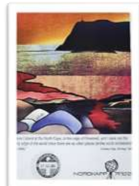
North cape Certificate