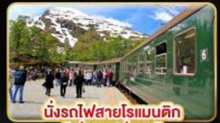
นั่งรถไฟสายโรแมนติก “พรมสปาน่า”