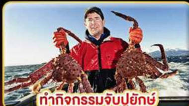
ทำกิจกรรมจับปูยักษ์ “พร้อมเมนูสุดพิเศษ”