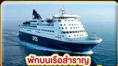
พักผ่อนเรือสำราญ แบบ Window Room 2 คืน