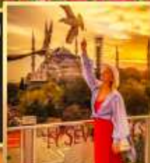
ลูปฟือปเซเวนฮิลล์ส