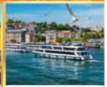
เรือเฟอร์รี่

เที่ยวครบเส้นทางยอดนิยม บินเข้าถึงเย็น เช้าชมสุเหร่ายักษ์คามลิก้า และล่องเรือเฟอร์รี่ ชมเทศกาลทิวลิปแห่งนครฮิสตันบูล