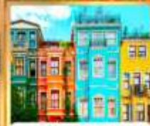
บ้านหลากสี คิสเลอร์ฟูล