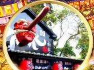
หมู่บ้านปิต่างชไต