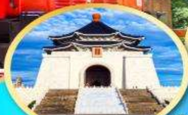
อนุสรณ์สถานเจียงไคเช็ค