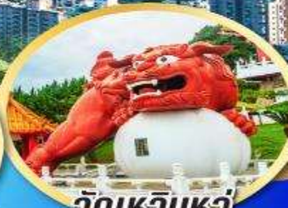
วัดเหวินหวู่