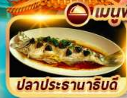
ปลาประธาราธิบดี