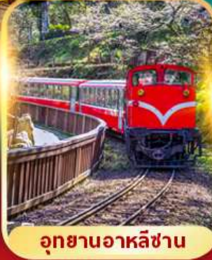
อุทยานอาหลี่ซาน