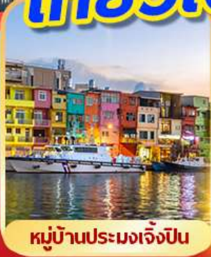
หมู่บ้านประมงเจ็ปโป

พักช้อปปิ้งถึง 1 คืน เที่ยวเต็ม!! ไม่มีอันอิสระ