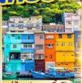
หมู่บ้านประมงเงินปิง