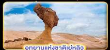
อุทยานแห่งชาติเยลโลว์