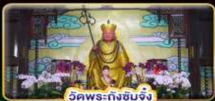
วัดพระถังซำจั๋ง

"ล่องเรือทะเลสาบสุริยันจันทรา" ขอความรักวัดหลงซาน