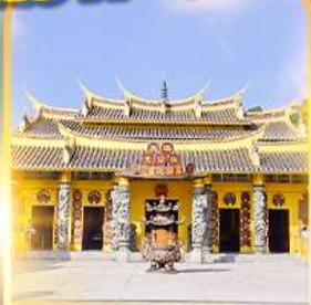
วัดชอพรเทพเจ้า