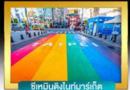
ซีเหมินดิงไนท์มาร์เก็ต