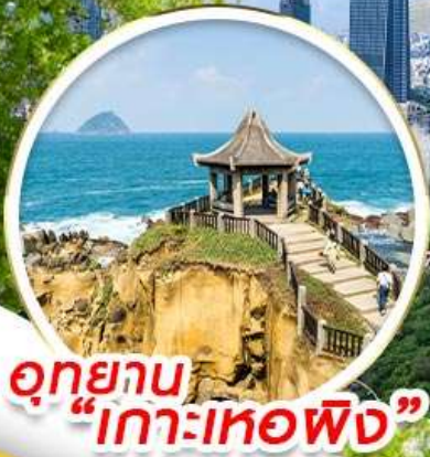
อุทยาน "เกาะเทอฟิง"