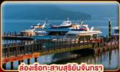
ส่งเรือทะเลสาบสุริยันจันทรา

"นั่งรถไฟชมอุทยานอาลีซาน" ปล่อยคอมลอยเส้นทางรถไฟผิงซี