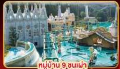
หมู่บ้าน 9 ชนเผ่า