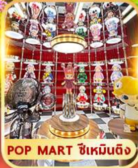
POP MART ซิเหมินตง