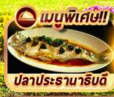
เมนูพิเศษ!! ปลาประจําหน้าริบดี