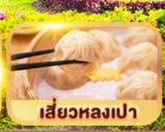
เสี่ยวหลงเปา