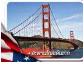
สะพานโกลเด้นเกต