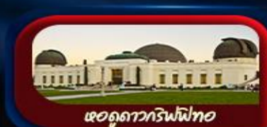
หอดูดาวกริฟฟิท

การันตี 10 ท่านออกเดินทาง พร้อมหัวหน้าทัวร์คนไทย