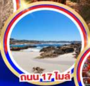
ถนน 17 ไมล์