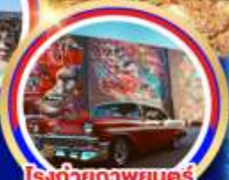
โรงถ่ายภาพยนตร์ ยูนิเวอร์แซล