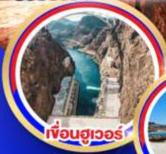
เฟือนฮูเวอร์

ช้อปปีงจูใจเอี๊ยทลีตออนคาร์โอบิลล์ ช้อปปีงบาร์สไตว์เอี๊ยทลีต