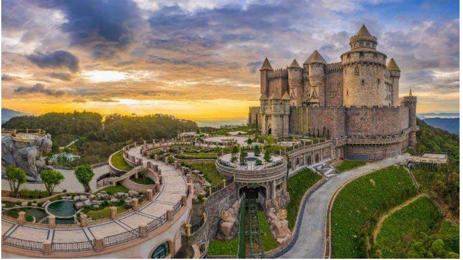
กลางวัน รับประทานอาหารกลางวัน ณ ภัตตาคาร (มีที่ 2) * เมนูพิเศษ บุฟเฟ่ต์นานาชาติ บนบานาฮิลล์