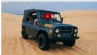
ทะเลทรายขาว