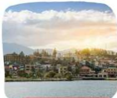
ทะเลสาบเมืองซาปา