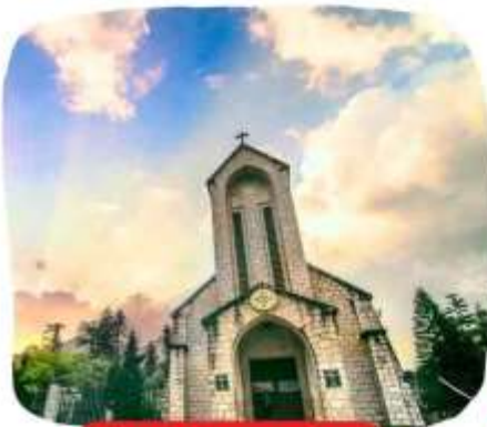
โบสถ์หินซาปา

แนะนำสถานที่ท่องเที่ยวในเมืองซาปา (ราคาทัวร์ไม่รวมค่าเดินทาง)