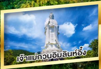
เจ้าแม่กวนอิมสินห์อิ่ง