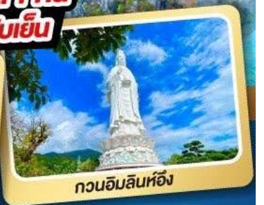
กวนอิมลินท้อ