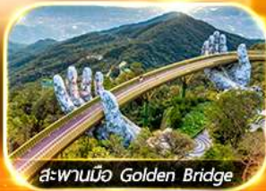
สะพานมือ Golden Bridge