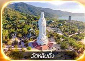
วัดหลินอึ้ง