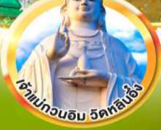
เจ้าแม่กวนอิม วัดหลินอิ่ง