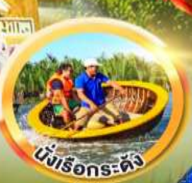
นั่งเรือกระดิง