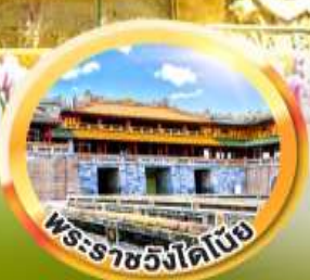
พระราชวังใต้โขง