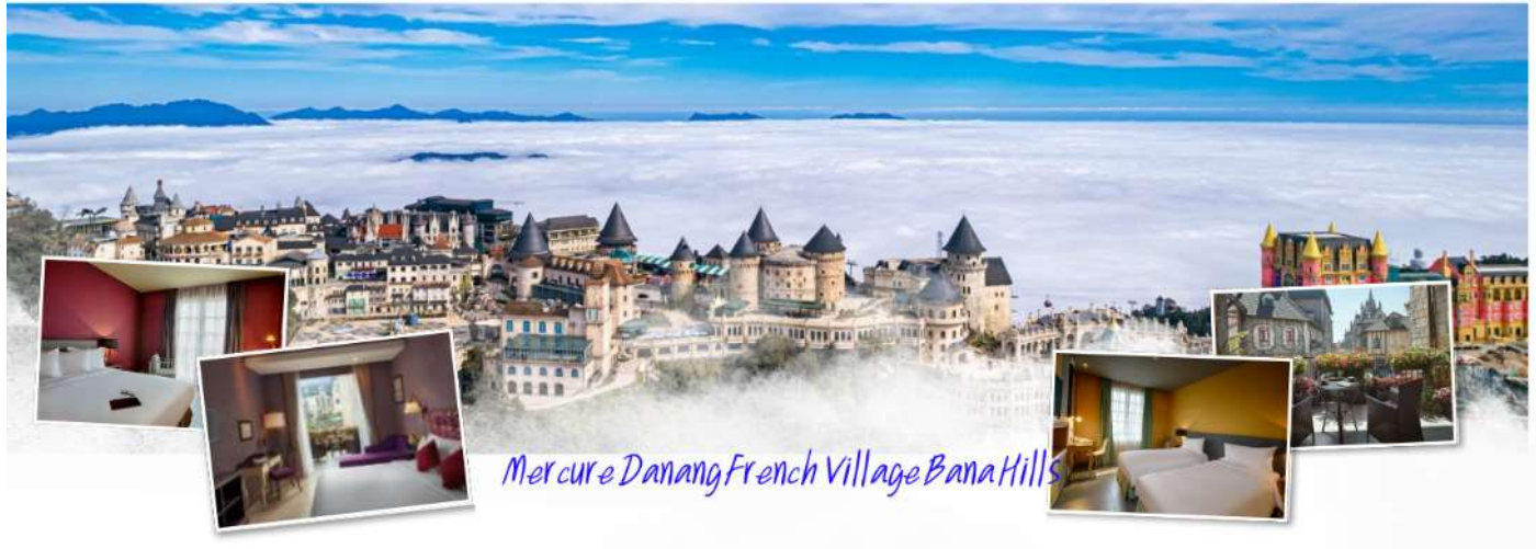
Mercure Danang French Village Bana Hills